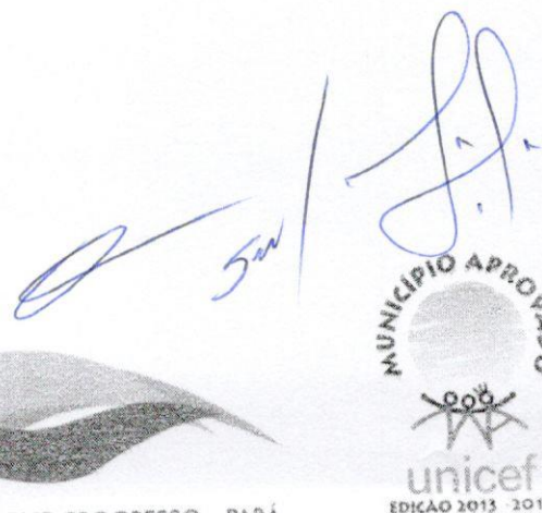
UBIRACI SOARES SILVA Prefeito Municipal

Gabinete do Prefeito Municipal de Novo Progresso, em 17 de Abril de 2019.